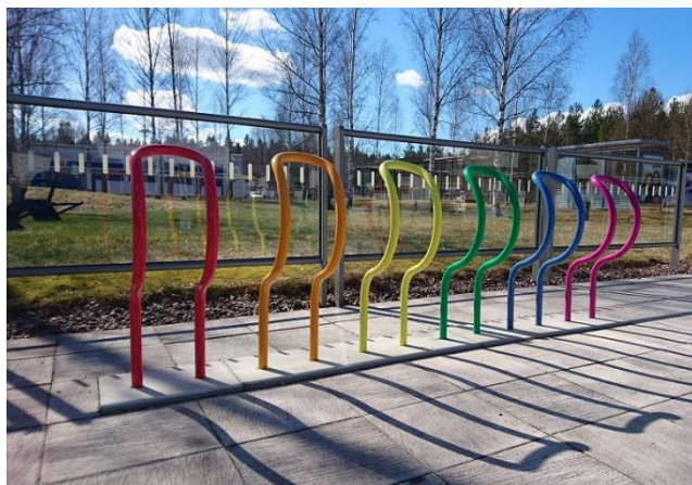
Fundamentet till det röda stället är kapat (special)